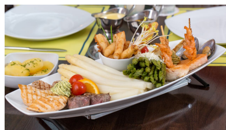
Spargelhof Winkelmann.jpg