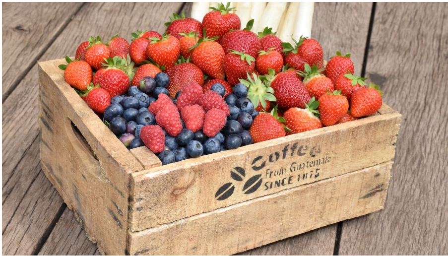
Spargelhof Winkelmann