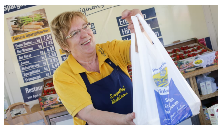
Spargelhof Winkelmann