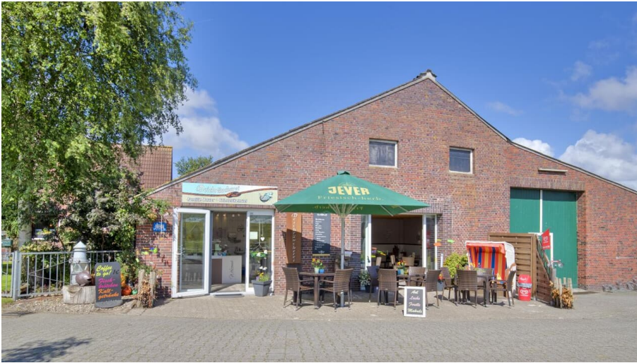
Gastro_Deichraueucherei-au脛enansicht.jpg -   Martin St ver