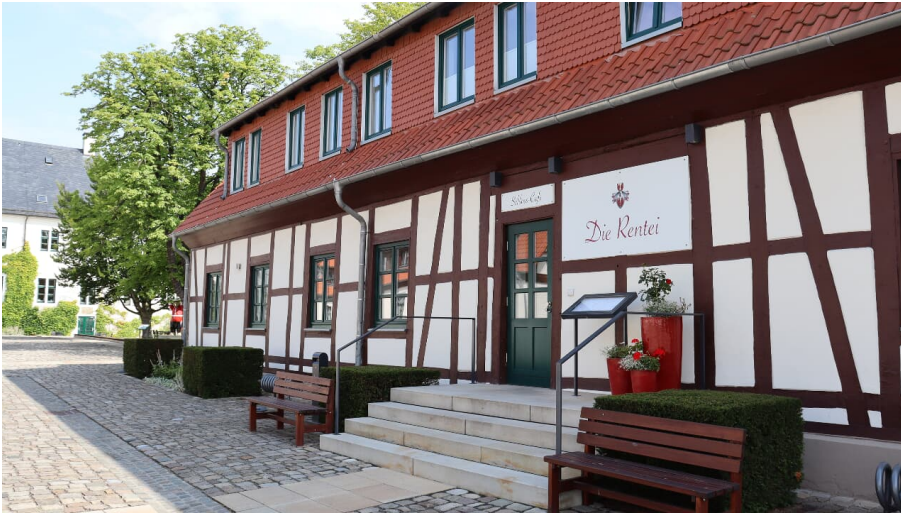
Die Rentei