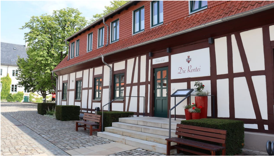
Die Rentei - © Anna-Lena Rose