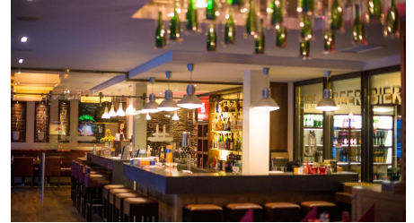
POI Schneiders am Brunnen (6 von 9)(1).jpg