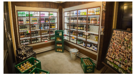
POI Schneiders am Brunnen (4 von 9)(1).jpg - © Simon Berg