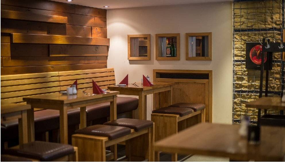
POI Schneiders am Brunnen (5 von 9)(1).jpg

für 11,50 € Sonn- und Feiertags von 09:30 bis 12:00 Uhr für 15,50 € Aufschnitt, Süßgebäck, Obst, Rührei, Bacon, Kaffee, Tee O-saft – so viel sie möchten.