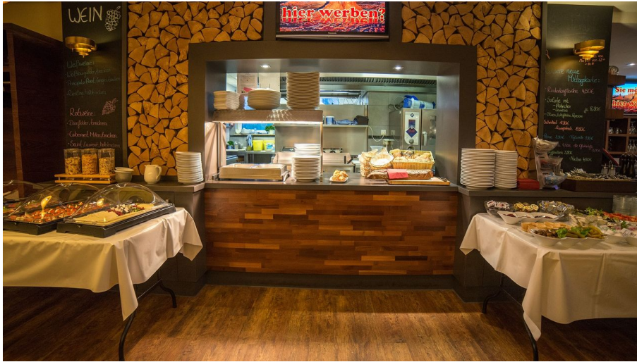
POI Schneiders am Brunnen (2 von 9) (1).jpg