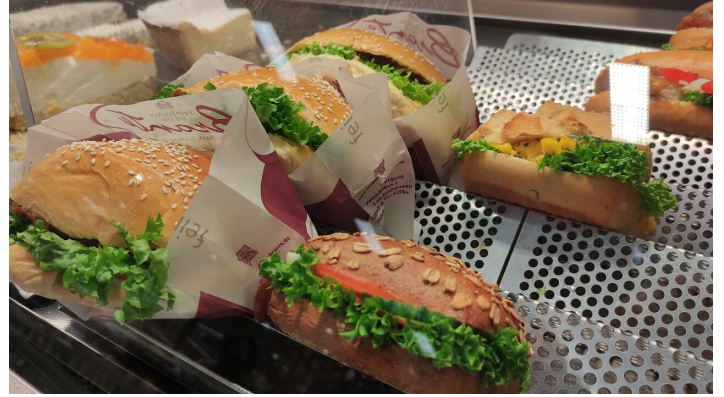
Brötchen Brante Vlotho