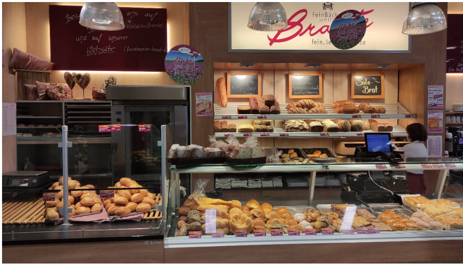
Brante Vlotho