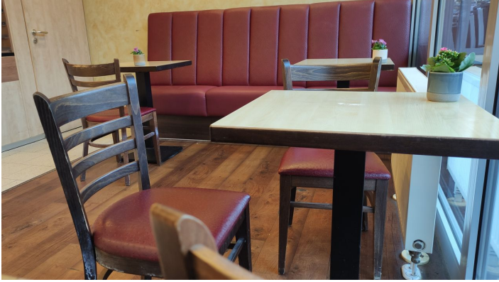
Sitzecke Brante Vlotho