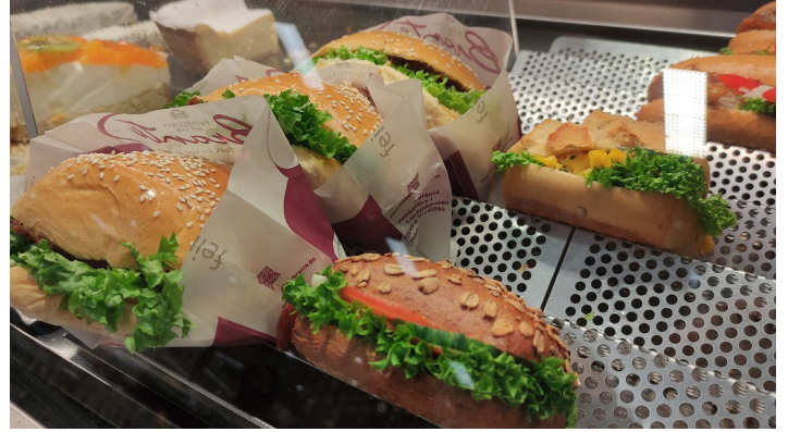
Brötchen Brante Vlotho