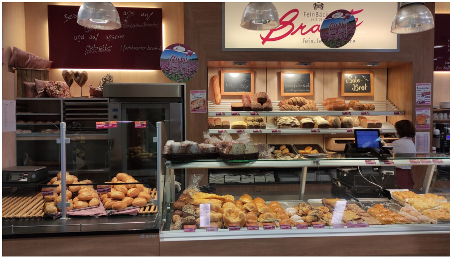
Brante Vlotho