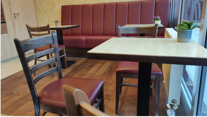
Sitzecke Brante Vlotho