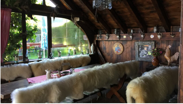
Kreutalm 3.jpg

Restaurant: täglich ab 10 Uhr Küchenzeiten: 11-21 Uhr Ruhetag: Mo (außer in den Ferien und an Feiertagen)