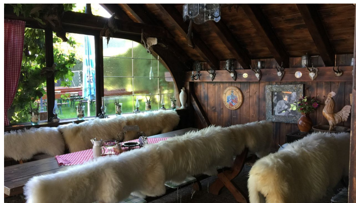
Kreutalm 3.jpg