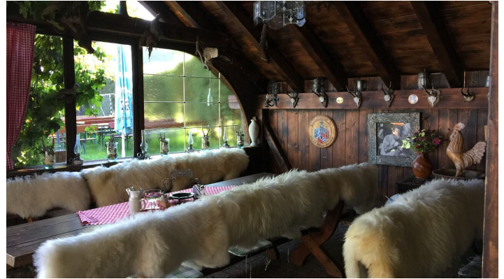
Kreutalm 3.jpg