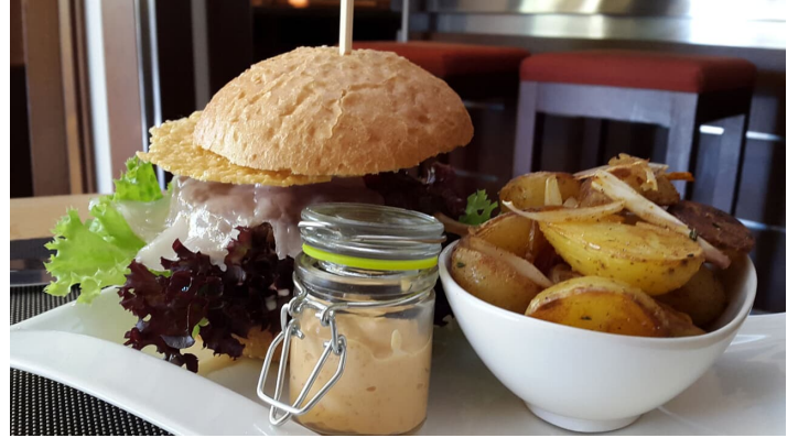
Restaurant Auszeit Murnau 2.jpg - © Restaurant Auszeit