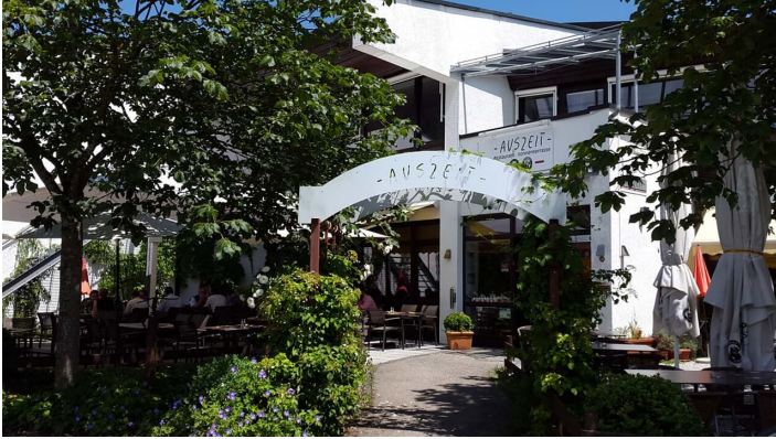
Restaurant Auszeit Murnau 1.jpg - © Restaurant Auszeit

Restaurant: Di-Fr: 18-23 Uhr Sa, So, Feiertag: 12-23 Uhr Küche: Di-Fr: 18-21 Uhr Sa, So, Feiertag: 12-14 Uhr & 18-22 Uhr