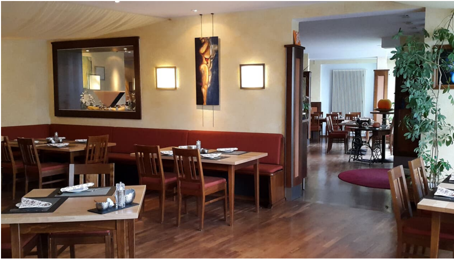
Restaurant Auszeit Murnau 3.jpg