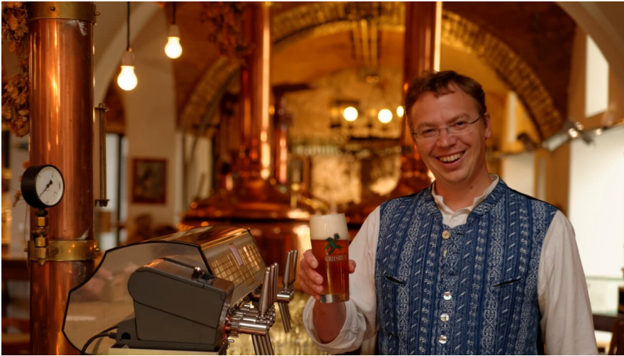
_ROI3763_DxO.JPG - © Griesbräu zu Murnau