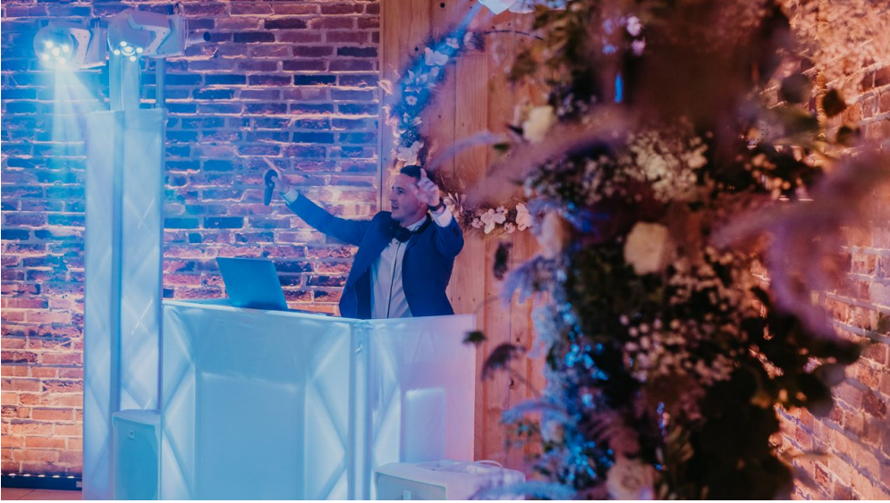
Scheune - Eventlocation