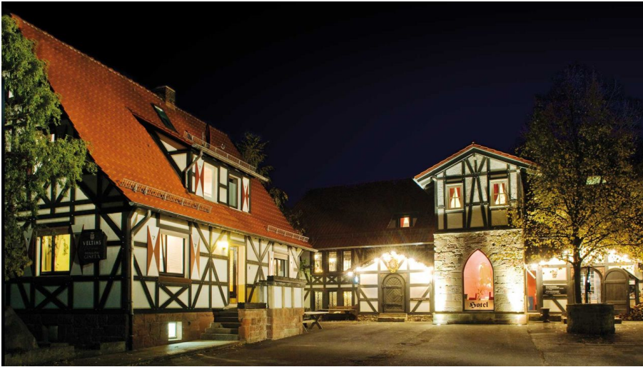
Restaurant der Grischäfer