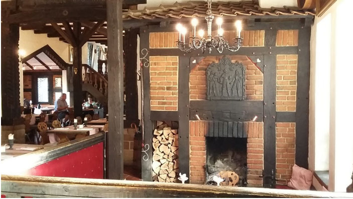
Restaurant der Grischäfer Gasträum - © Brüder Holzauer