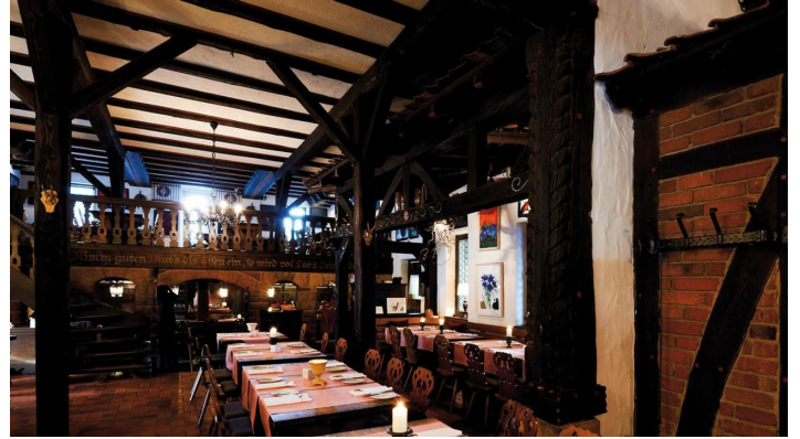
der Grischäfer Innenraum mit Galerie