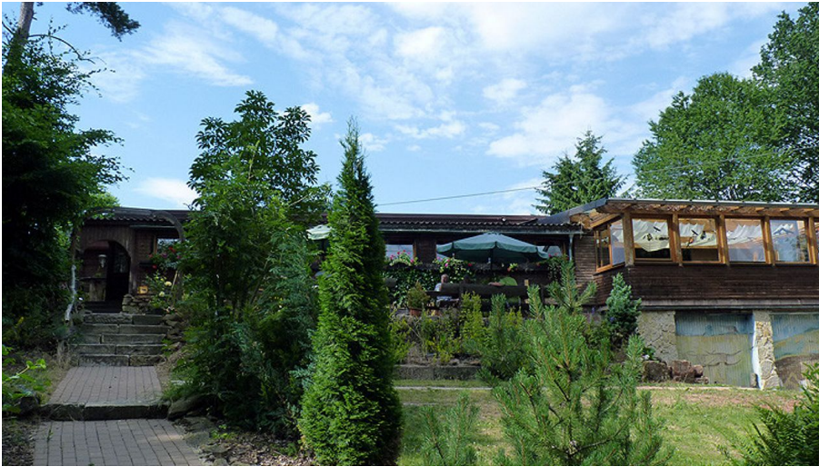
Cafe Hasenacker Naumburg