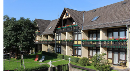
Hotel Combecher Außenansicht