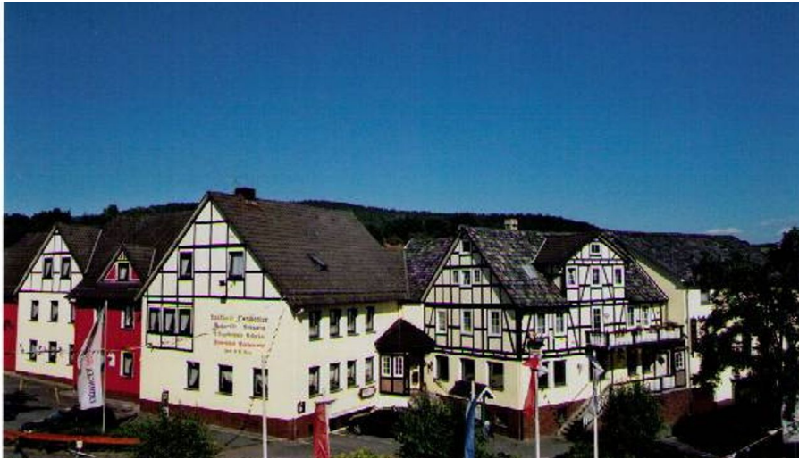
Landhotel Combecher