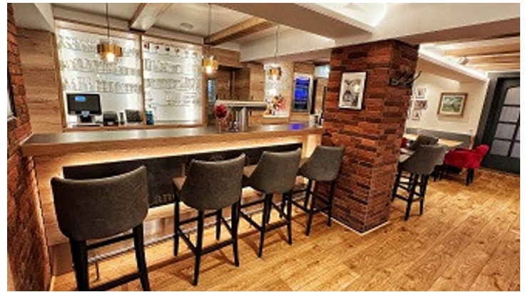
Hotel Combecher Innenansicht