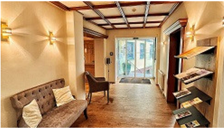
Hotel Combecher Innen