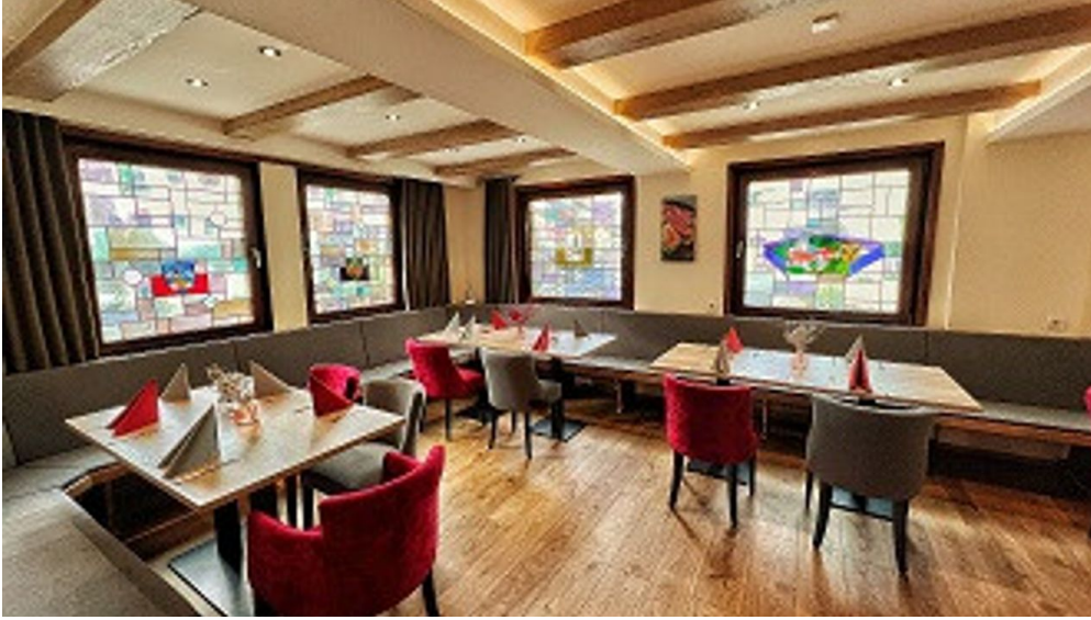
Hotel Combecher