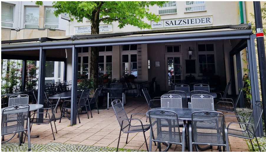
Restaurant Salzsieder | Salzkotten