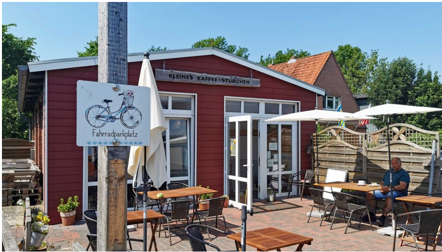
Kleines Kaffeestübchen