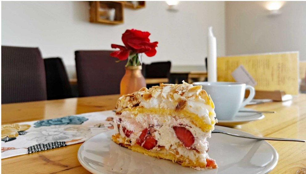
Kleines Kaffeestübchen: Trümmertorte