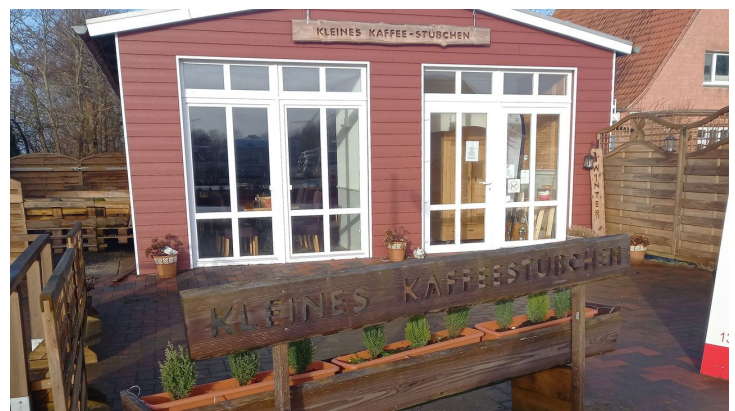
Kleines Kaffee-Stübchen in Hemme