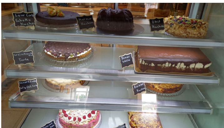
Kleines Kaffee-Stübchen innen