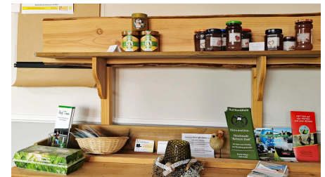
Kleines Kaffeestübchen: Hofladen-Ecke - © Dithmarschen Tourismus