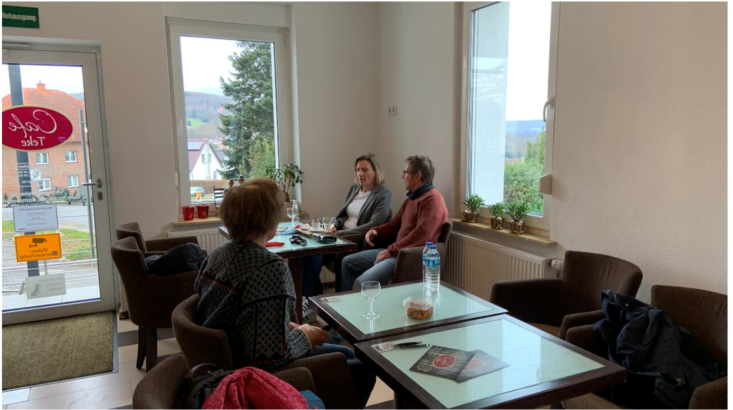
Cafe Teke Innenbereich