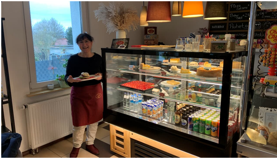
Cafe Teke Tresen