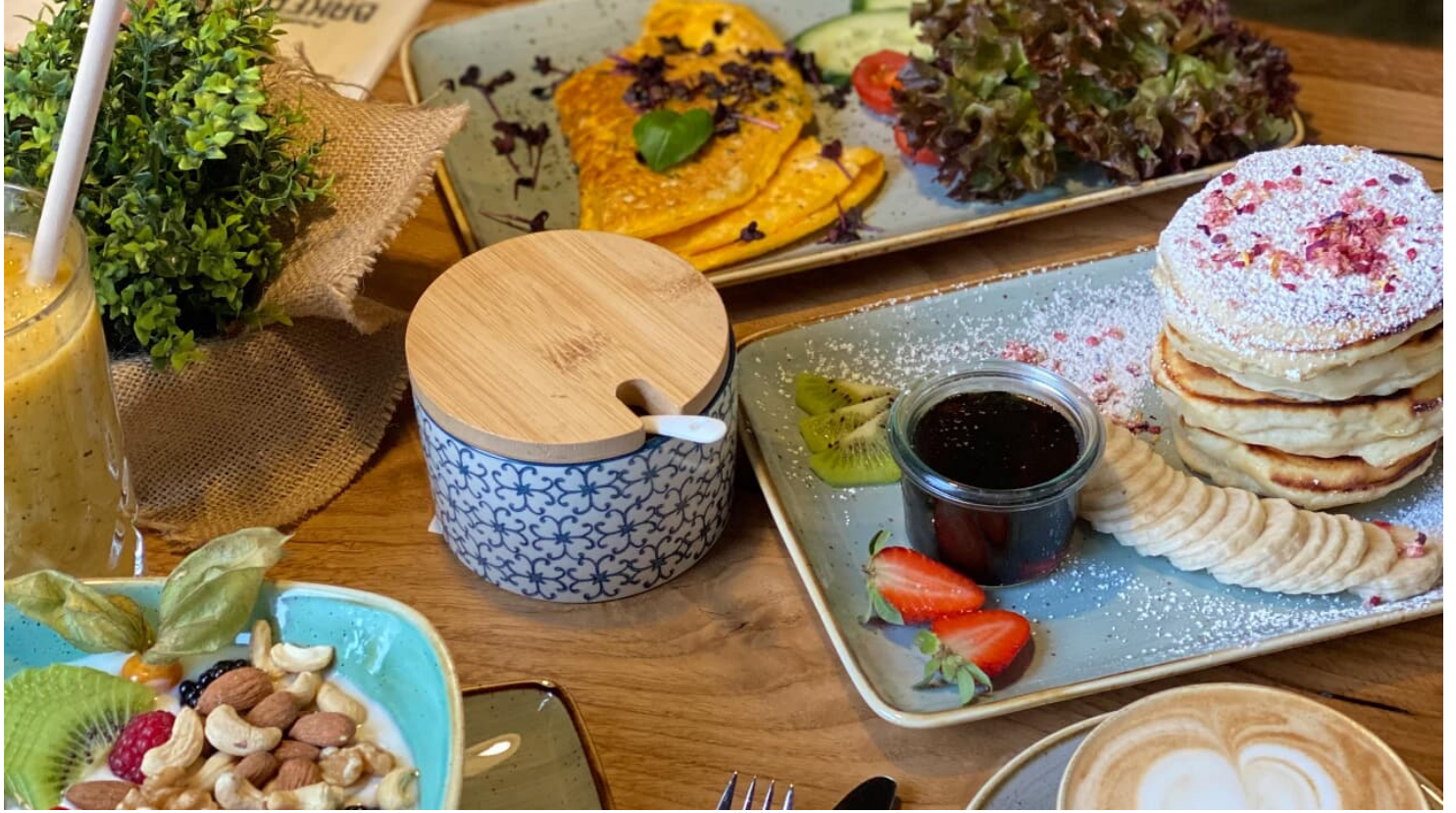
Moun10 Bakers Speisen