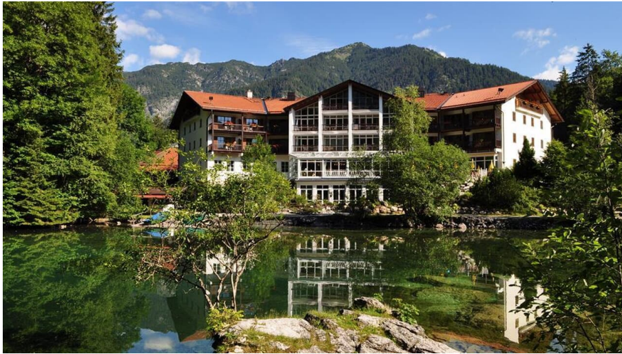
Hotel am Badersee