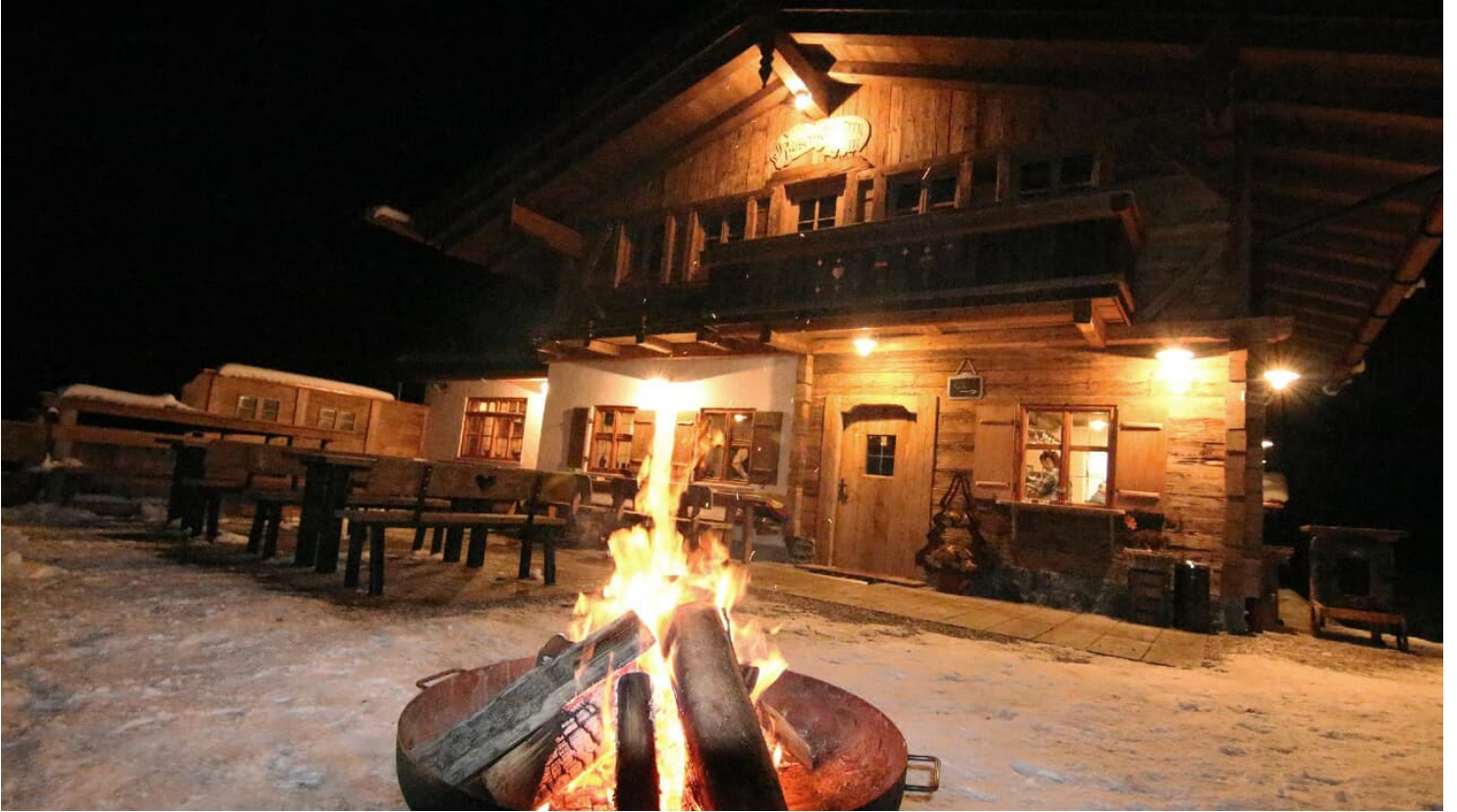
Kaiserschmarrn Alm im Winter