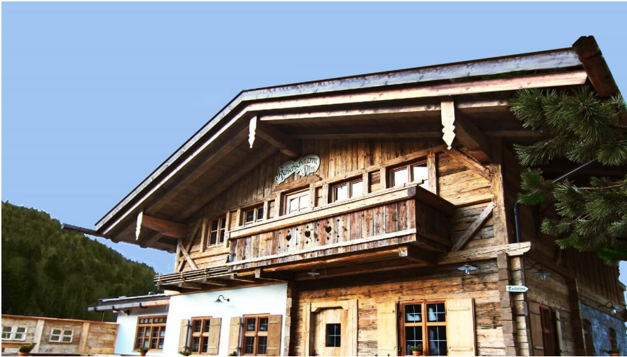
Kaiserschmarrn Alm im Sommer