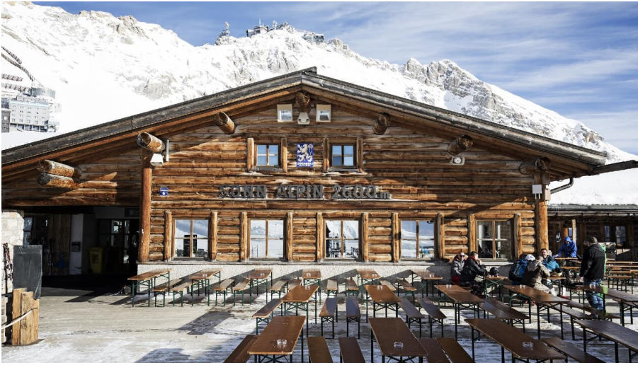
Sonn Alpin