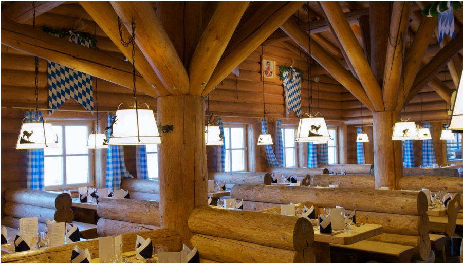
Restaurant Sonnalpin