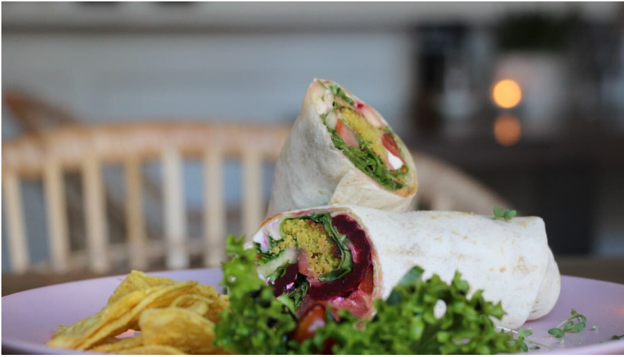
Café Max Wraps

Das Café Max wird von 2 jungen Frauen aus Murnau geführt. Neben Frühstücksplatten zum selbst zusammenstellen und leckeren Bowls, gibt es auch Kaffee aus der Murnauer Kaffeerösterei und hausgemachte Kuchen. Nachmittags stehen Wraps und Salate, sowie variierende Tagesangebote auf der Karte.