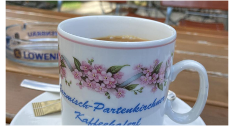
Kaffee auf der Werdenfelser Hütte