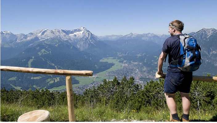
Aussicht Naturkino am Wank