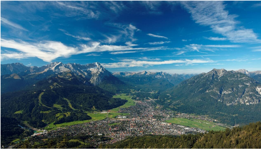
Blick von Wank ins Tal

Das Wankhaus liegt auf 1780 m Höhe im Estergebirge in den Bayerischen Voralpen auf dem Gipfel des Wank. Die Hütte wird von der Sektion Garmisch-Partenkirchen des Deutschen Alpenvereins nahezu ganzjährig bewirtschaftet. Familie Simon lädt Sie herzlich ein, es sich auf der Sonnenterrasse oder in der Stube gemütlich zu machen und die gute Küche zu genießen!