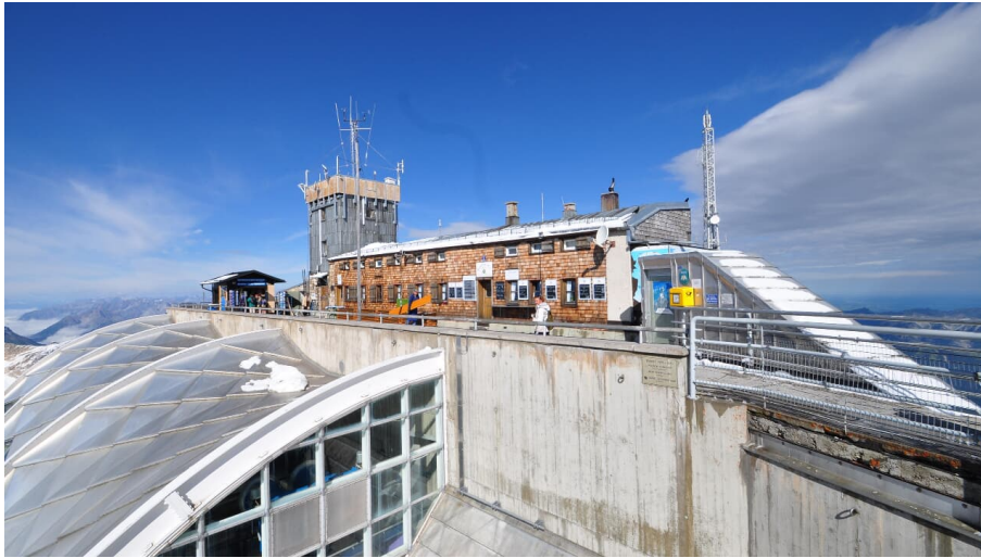
Münchner Haus 1

Das Münchner Haus auf der Zugspitze ist eine Alpenvereinshütte der Sektion München des Deutschen Alpenvereins. Die Hütte der Kategorie II liegt am Westgipfel der Zugspitze auf einer Höhe von 2959 m ü. NHN und ist somit das höchstgelegene Schutzhaus in den deutschen Alpen.