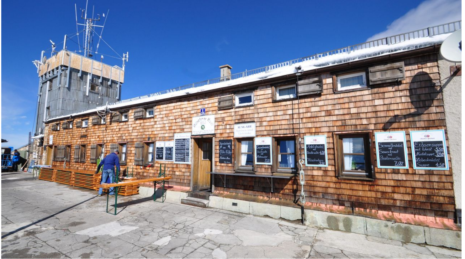
Münchner Haus 2