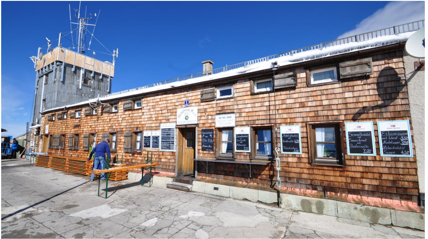
Münchner Haus 2