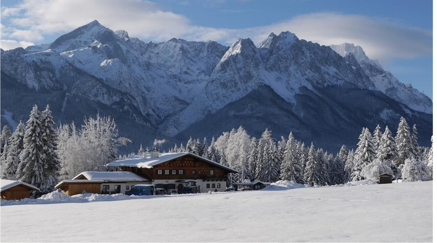
Almhütte im Winter