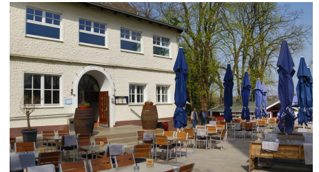
El Castillo