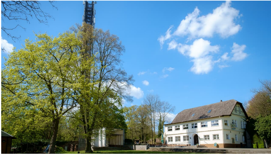
El Castillo

Das spanische Restaurant ist hoch oben auf dem Berg gelegen und bietet im Sommer mit dem Biergarten eine weite Aussicht.