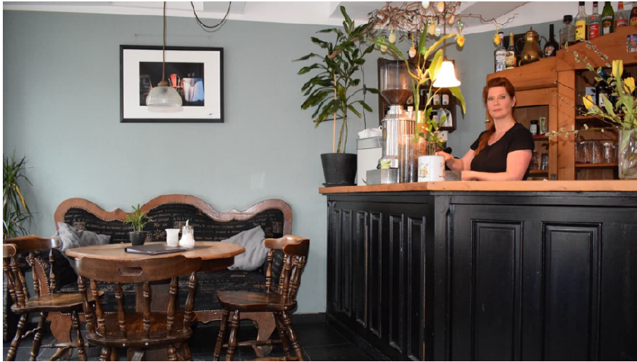
Café am Markt in Mettmann