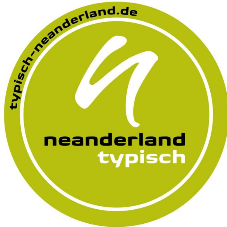
TYPISCH neanderland Siegel