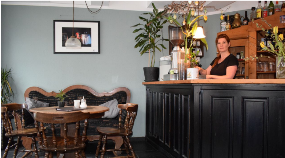
Café am Markt in Mettmann