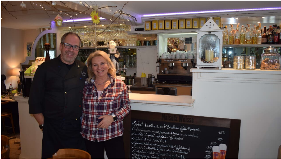
Inhaber des Restaurants La Pieve in Mettmann - © Kreis Mettmann