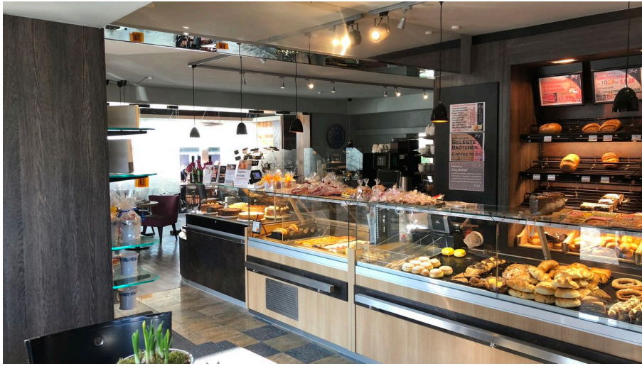
Droste Cafe, Konditorei u. Catering in Ratingen