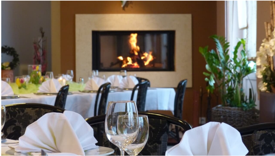
Saal im Haus der Gastlichkeit, Ratingen