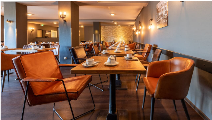
Essential Sellmann Restaurant.jpg