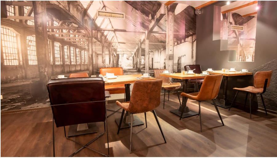
Restaurant Sellmann