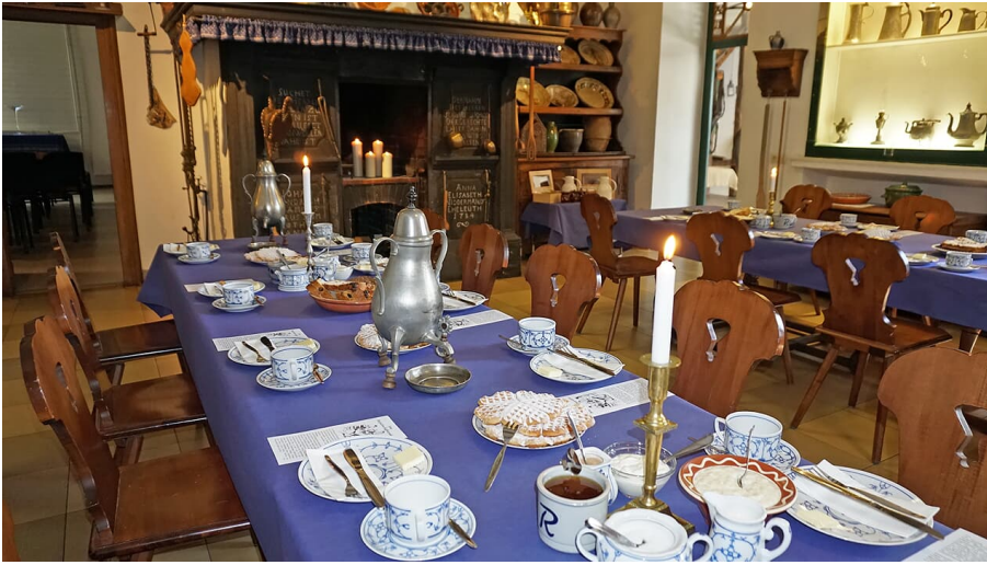
Gedeck Bergische Kaffeetafel im Niederbergischen Museum Wülfrath