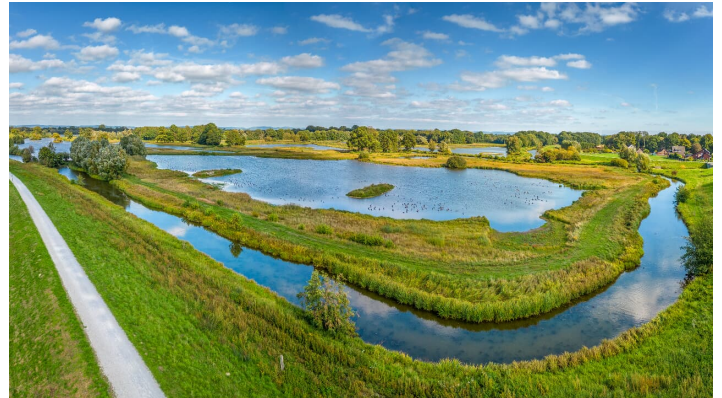
Delbrueck-Steinhorster Becken-Teutoburger-Wald-Tourismus-D-Ketz-079-CC-BY-SA.jpg