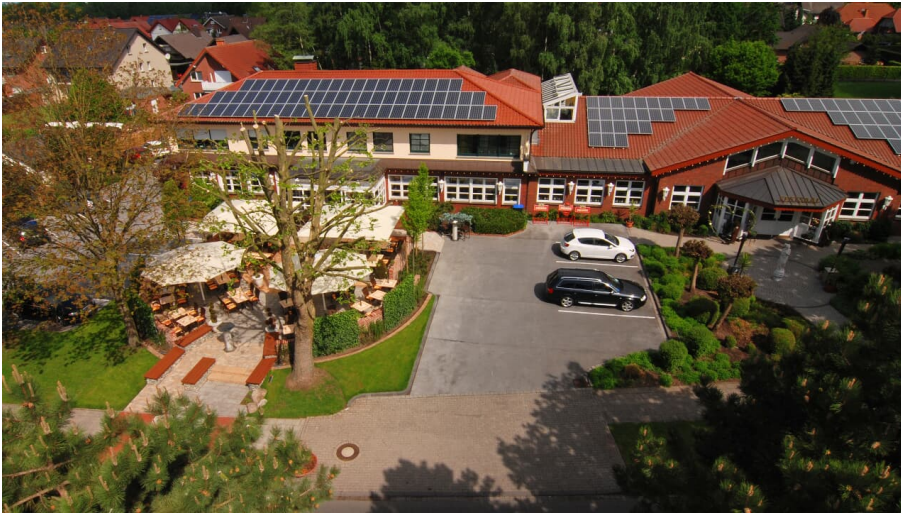
Hotel Schnittker | Delbrück