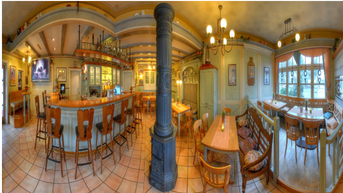
Hotel Schnittker | Delbrück