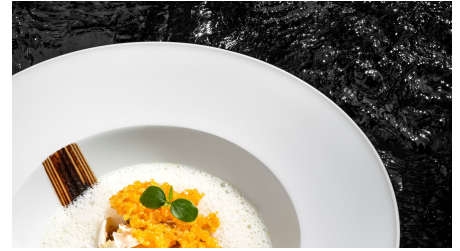
Eigelb im Sojasud pochiert Champignon, Mais & schwarzer Knoblauch