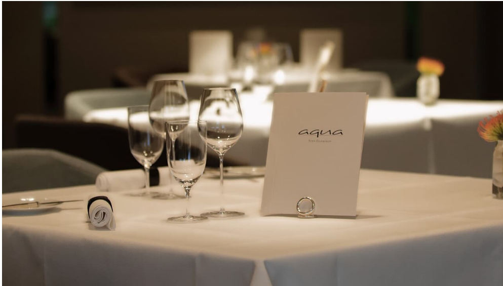
Restaurant Aqua