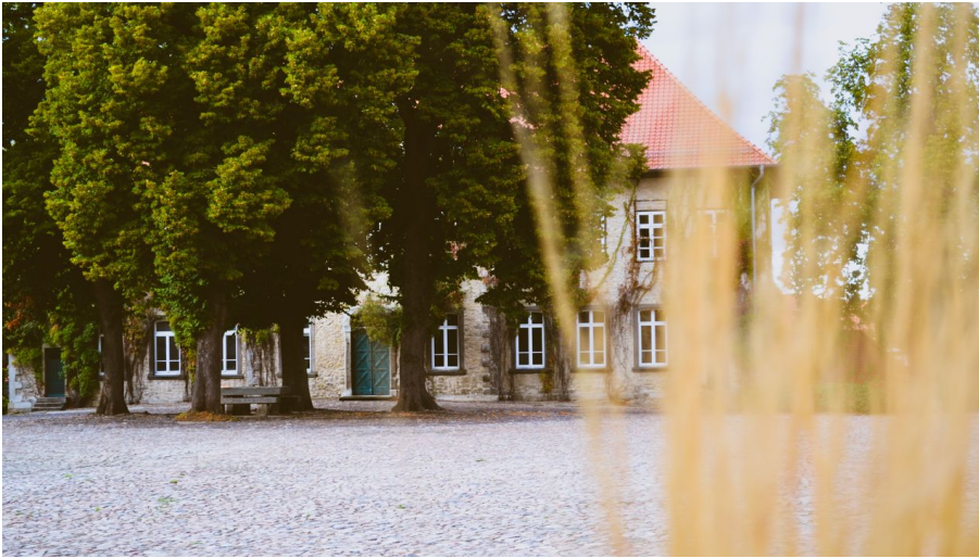
Gutshaus auf dem Rittergut Nordsteimke