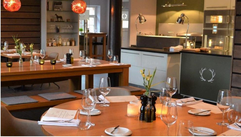
wildfrisch Gutsküche