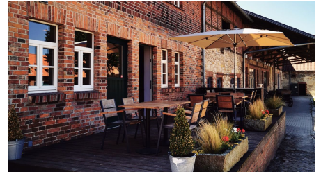
Außenterrasse Restaurant wildfrisch Gutsküche