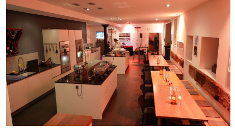
Küche im Restaurant wildfrisch