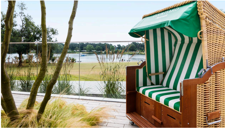
Allerlei im Courtyard