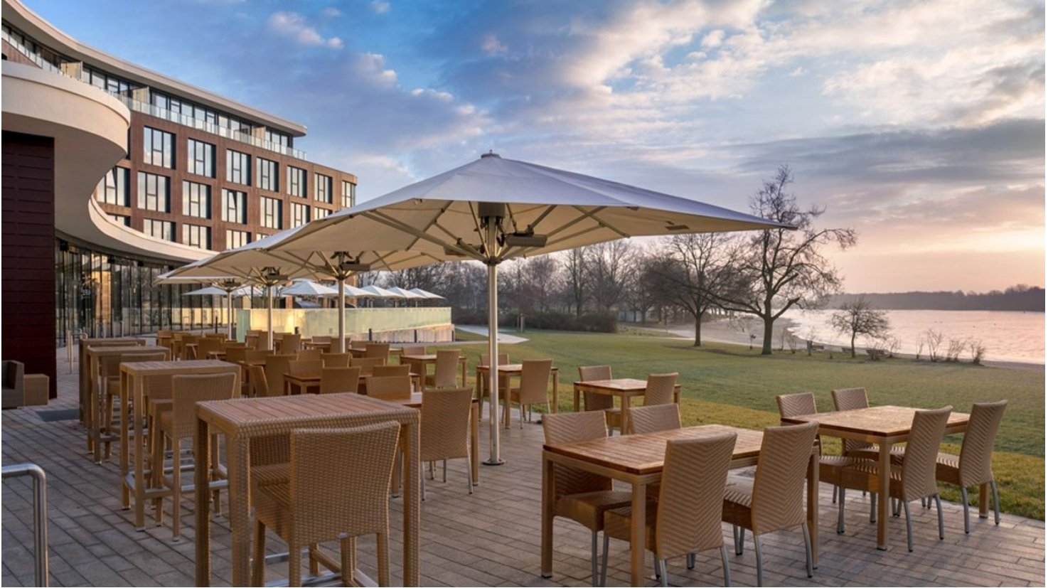
Allerlei im Courtyard