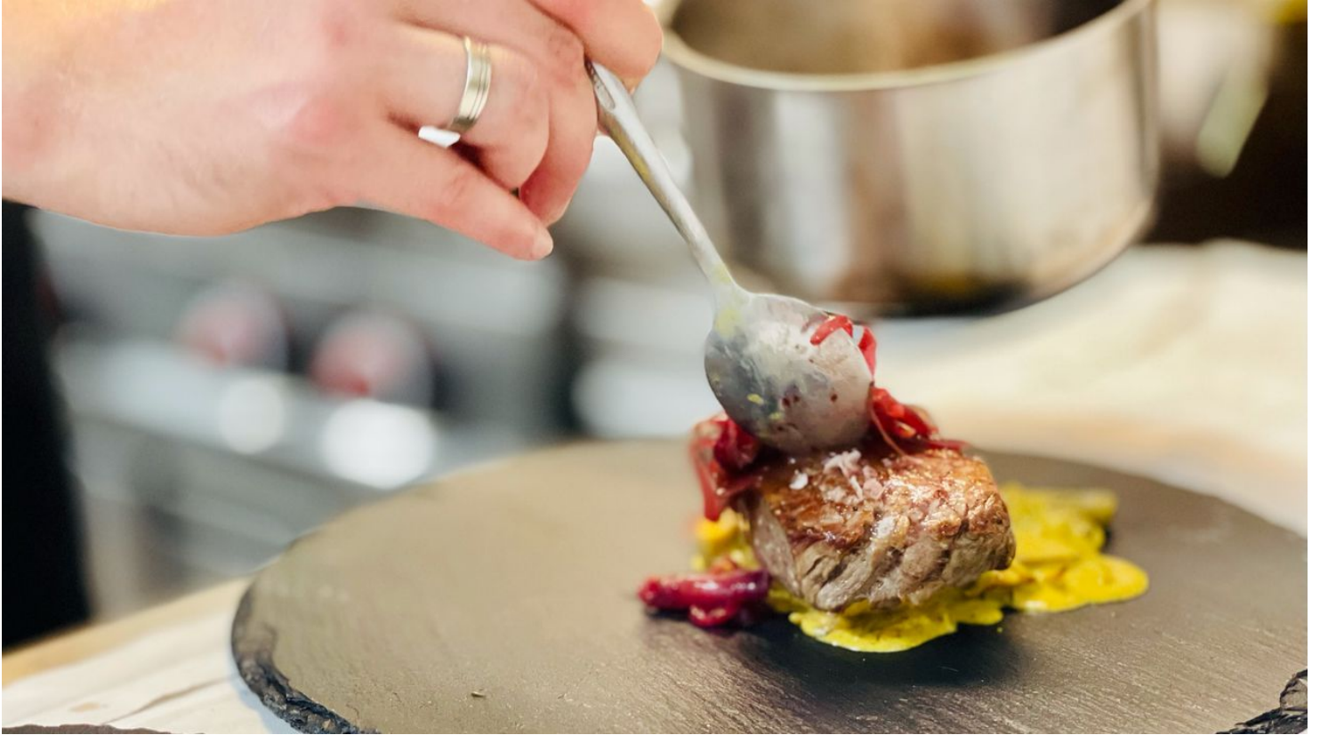
NAKUK-Landhotel Restaurant.jpg