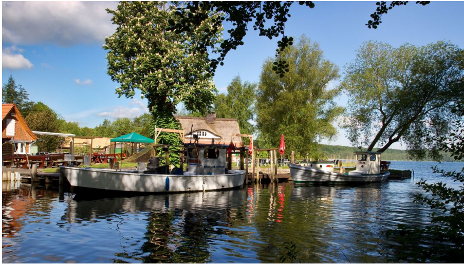
Fischerei Jobmann, Jens Butz.jpg

Ausflugslokal | Biergarten | Fischlokal | Restaurant