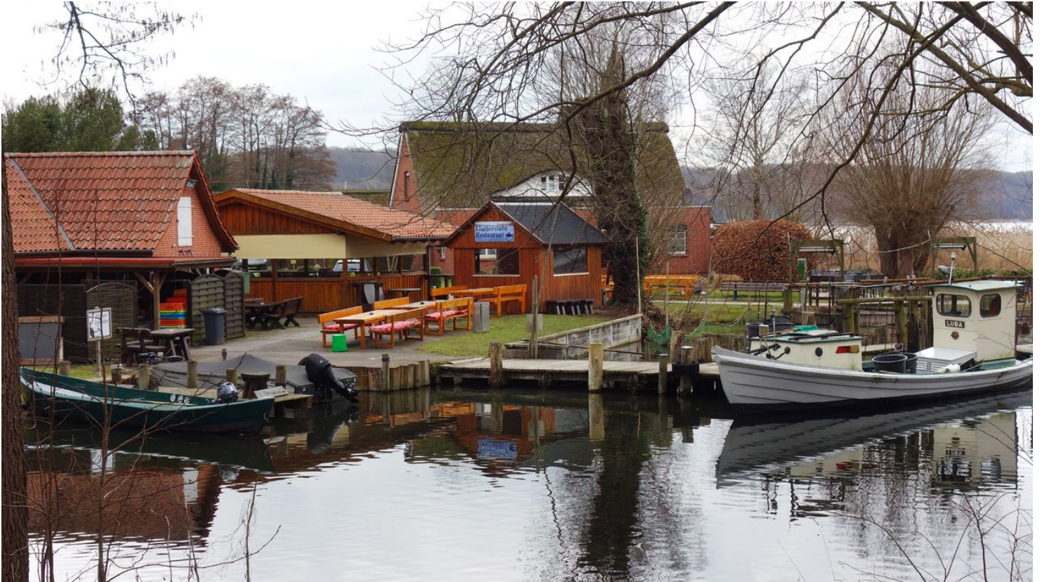
Fischerstube Jobmann - Bernadette Raffenberg 09.03.23.JPG

Donnerstag 09:00–17:00 Freitag 08:30–17:00 Samstag 08:30–17:00 Sonntag 10:00–17:00 Montag Geschlossen Dienstag 09:00–17:00 Mittwoch 09:00–17:00