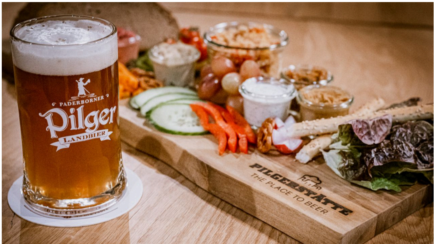
Abendbrotplatte mit Käse in der Pilgerstätte - © Teutoburger Wald / Pilgerstätte, Pilgerstätte - the place to beer