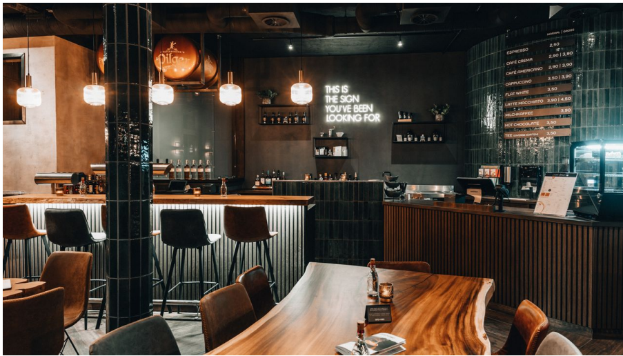
Innenraum coffee.family - © Teutoburger Wald / coffee.family