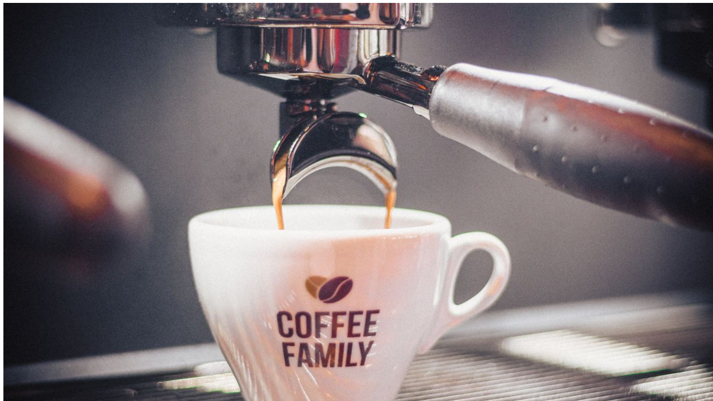
coffee.family Tasse unter Siebträgermaschine