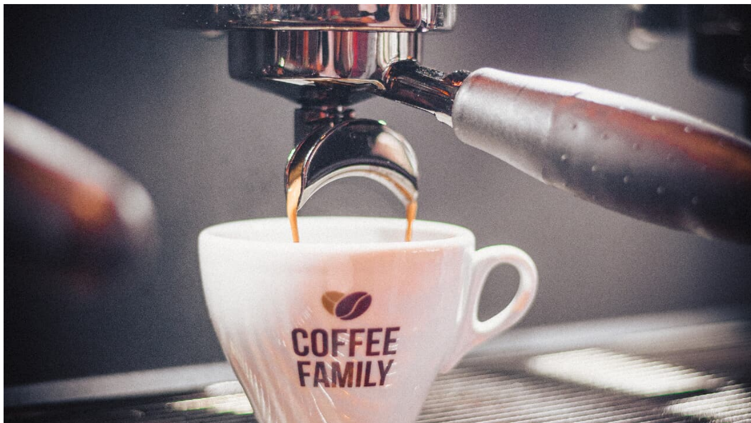
coffee.family Tasse unter Siebträgermaschine