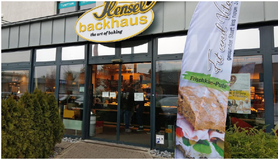
Bäckerei Hensel Uferstraße