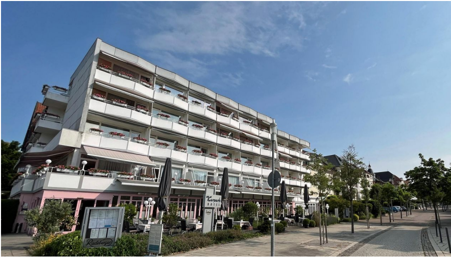
Restaurant im Kurparkhotel