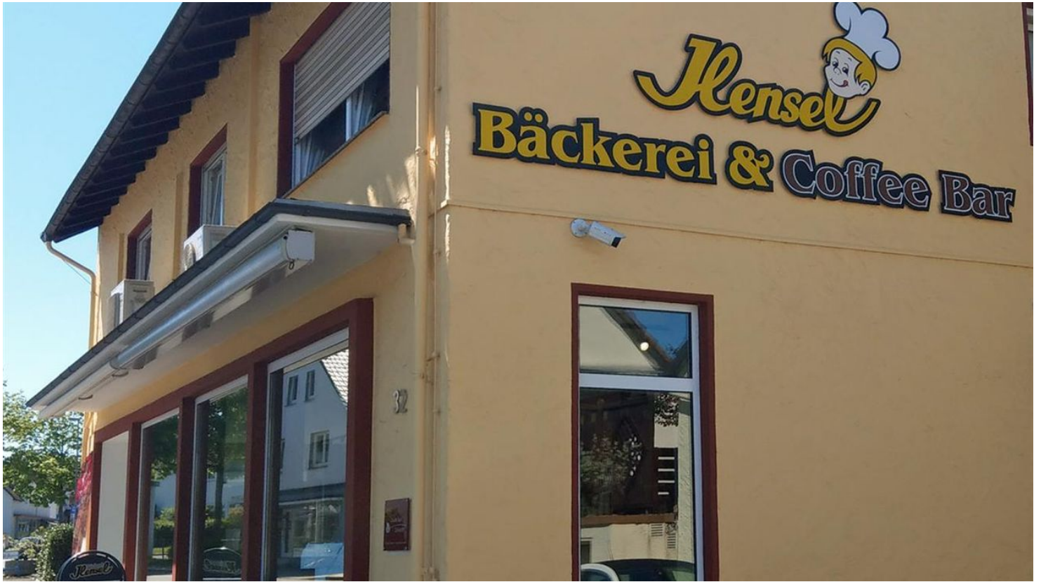
Hensel Bielefelder hoch