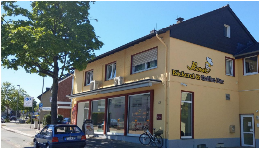
Hensel Bielefelder quer