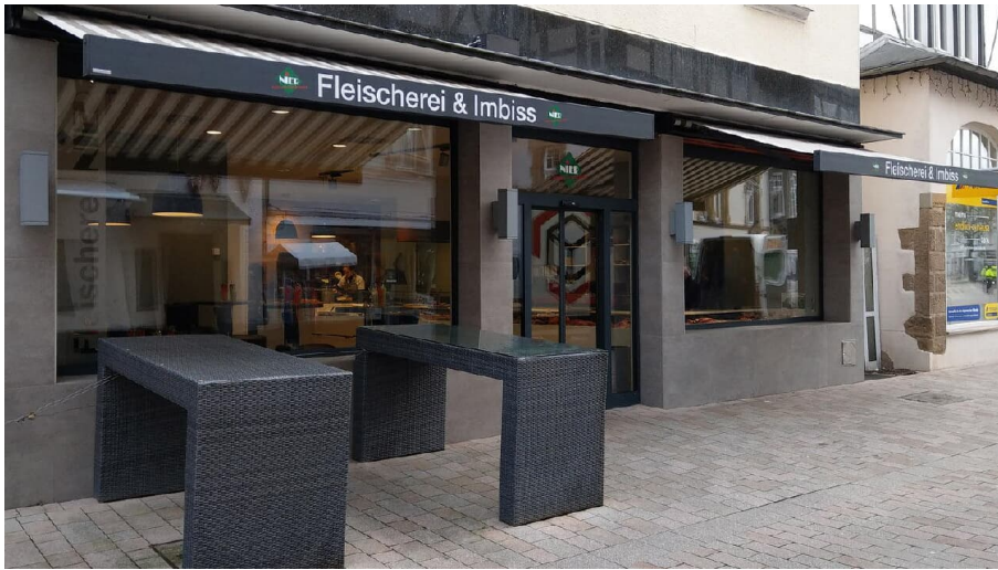
Fleischerei Nier quer - © Stadt Bad Salzufen / Oliver Siekmann