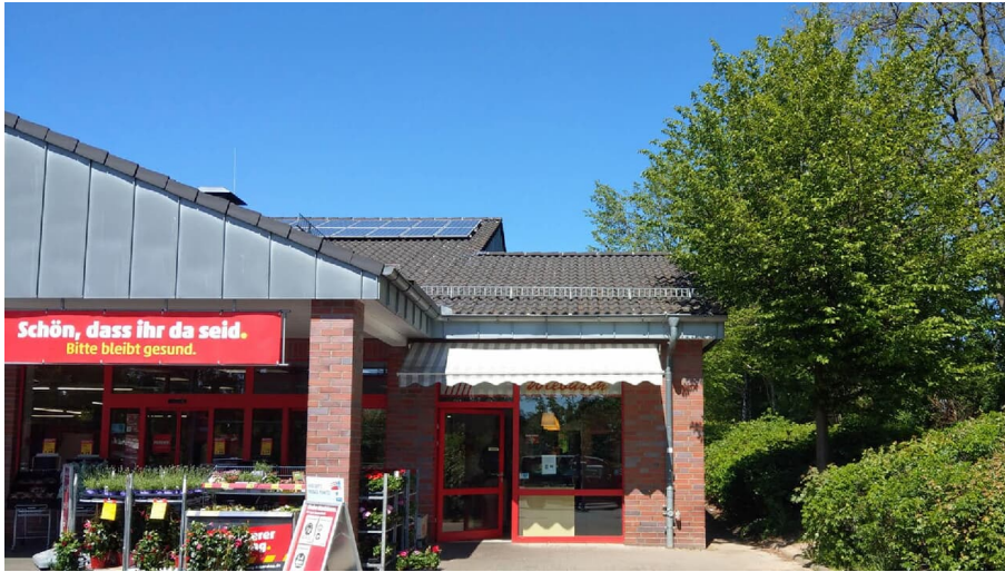
Bielefelder Straße 10 quer - © Stadt Bad Salzufflen / Oliver Siekmann