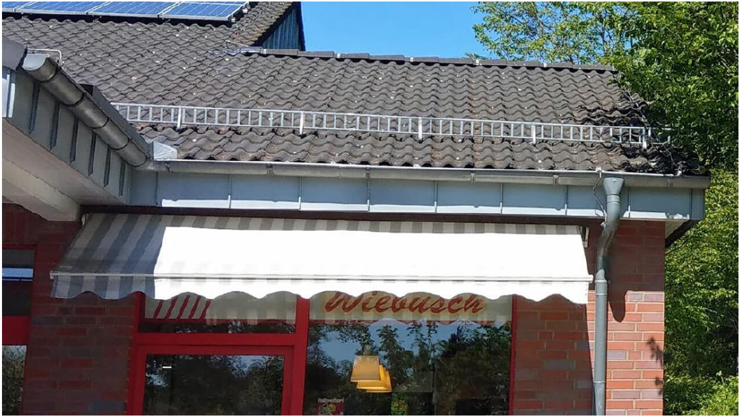
Bielefelder Straße 10 hoch