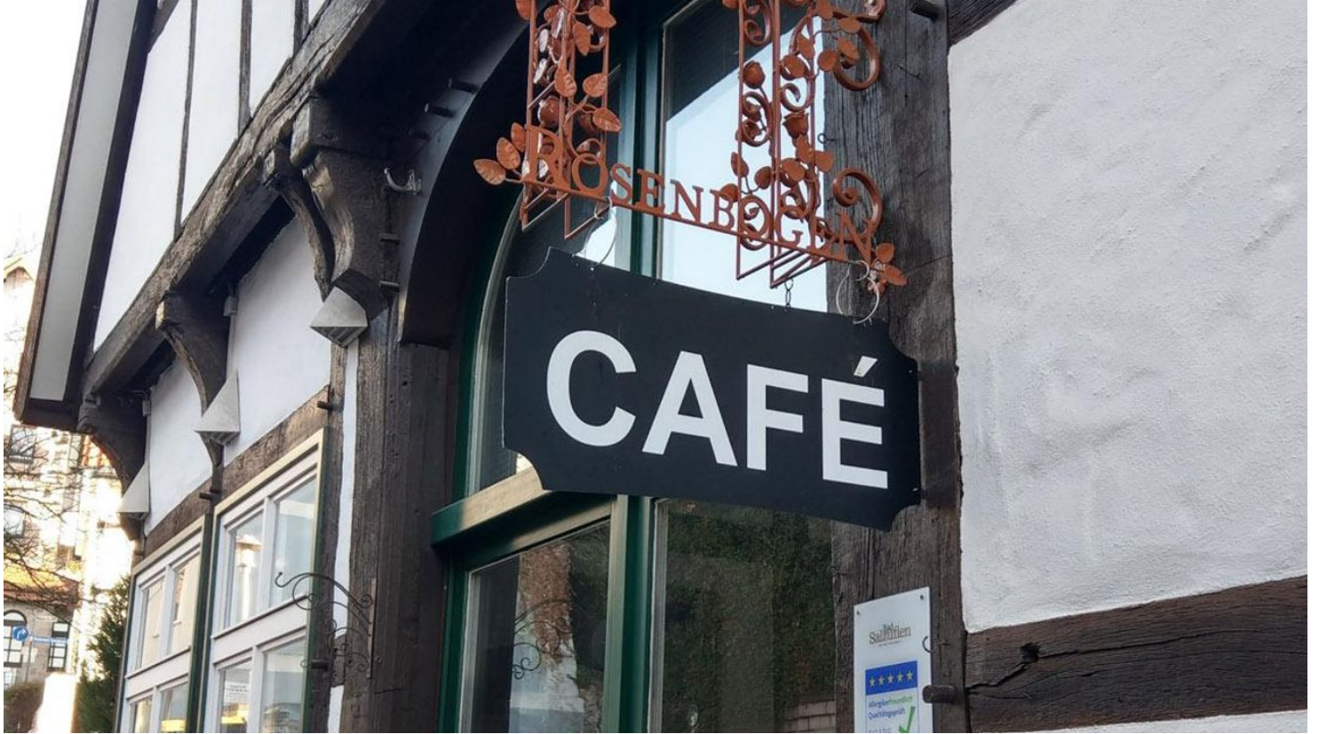
Café Rosenbogen hoch