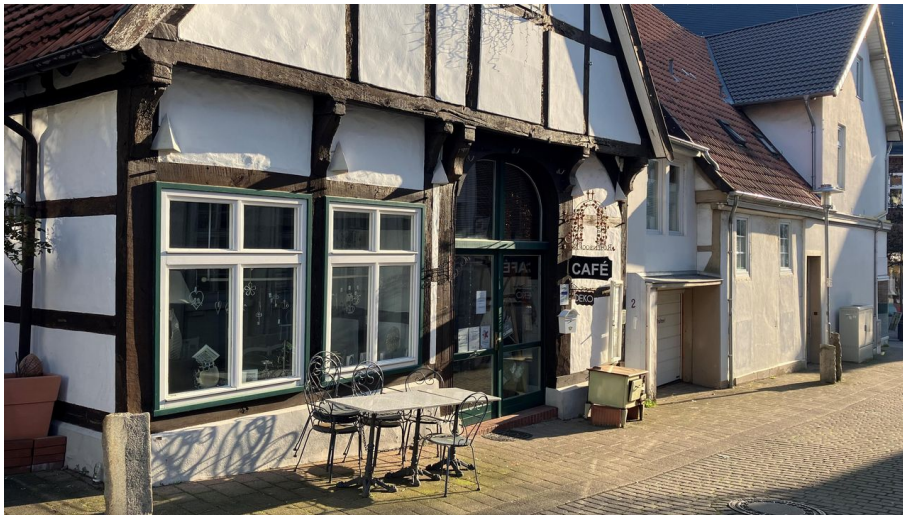
Café Rosenbogen_1