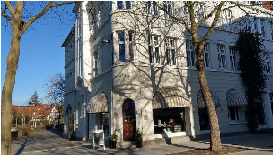
Kleiner Grünauer quer