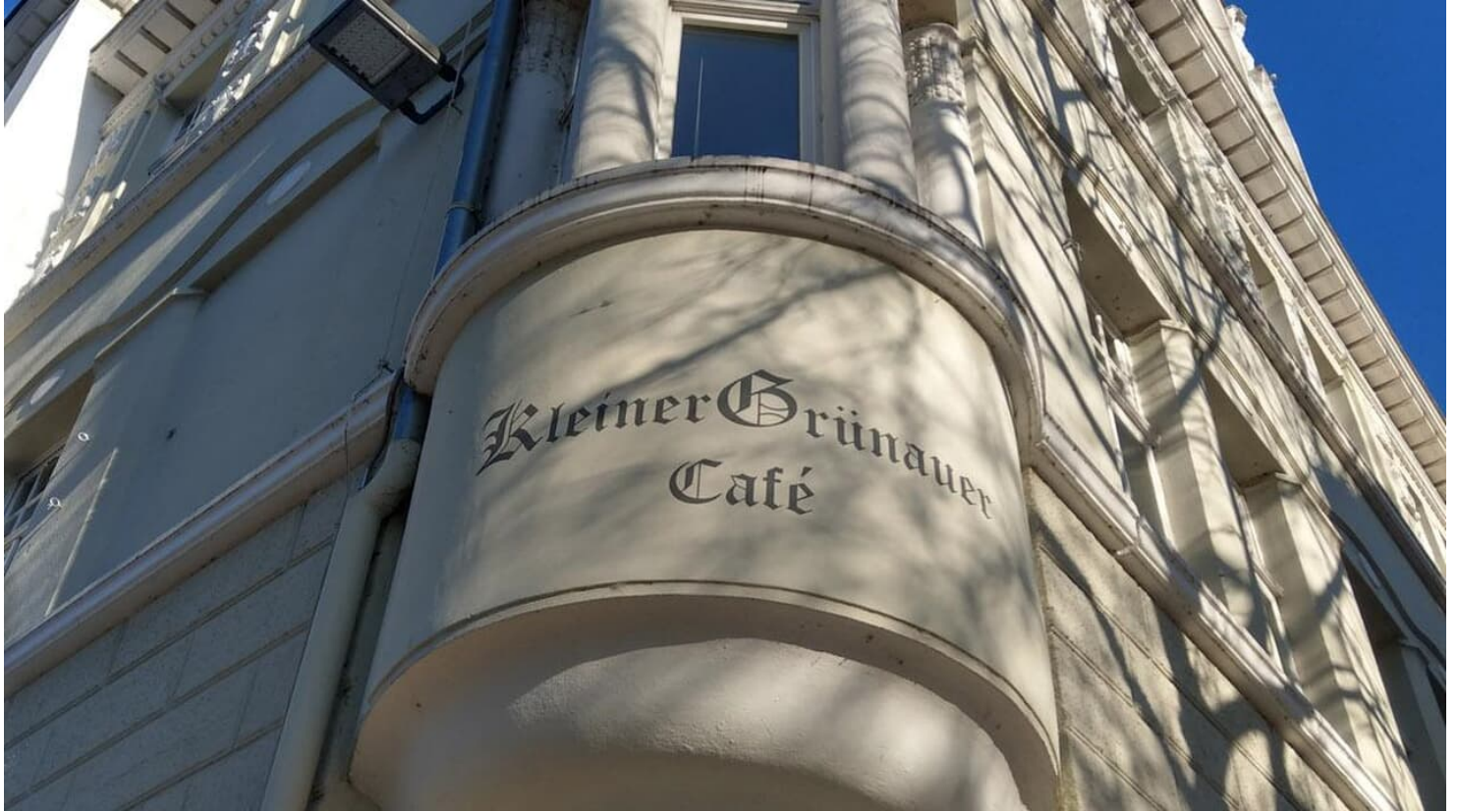
Kleiner Grünauer hoch