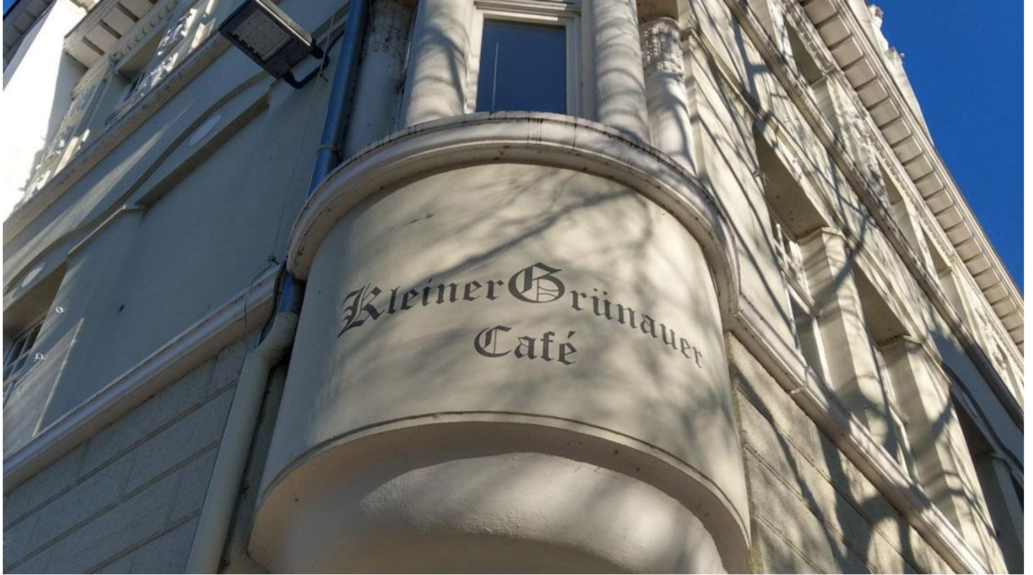
Kleiner Grünauer hoch - © Stadt Bad Salzuffen / Oliver Siekmann