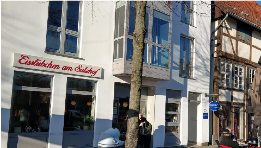
Eisstübchen am Salzhof quer