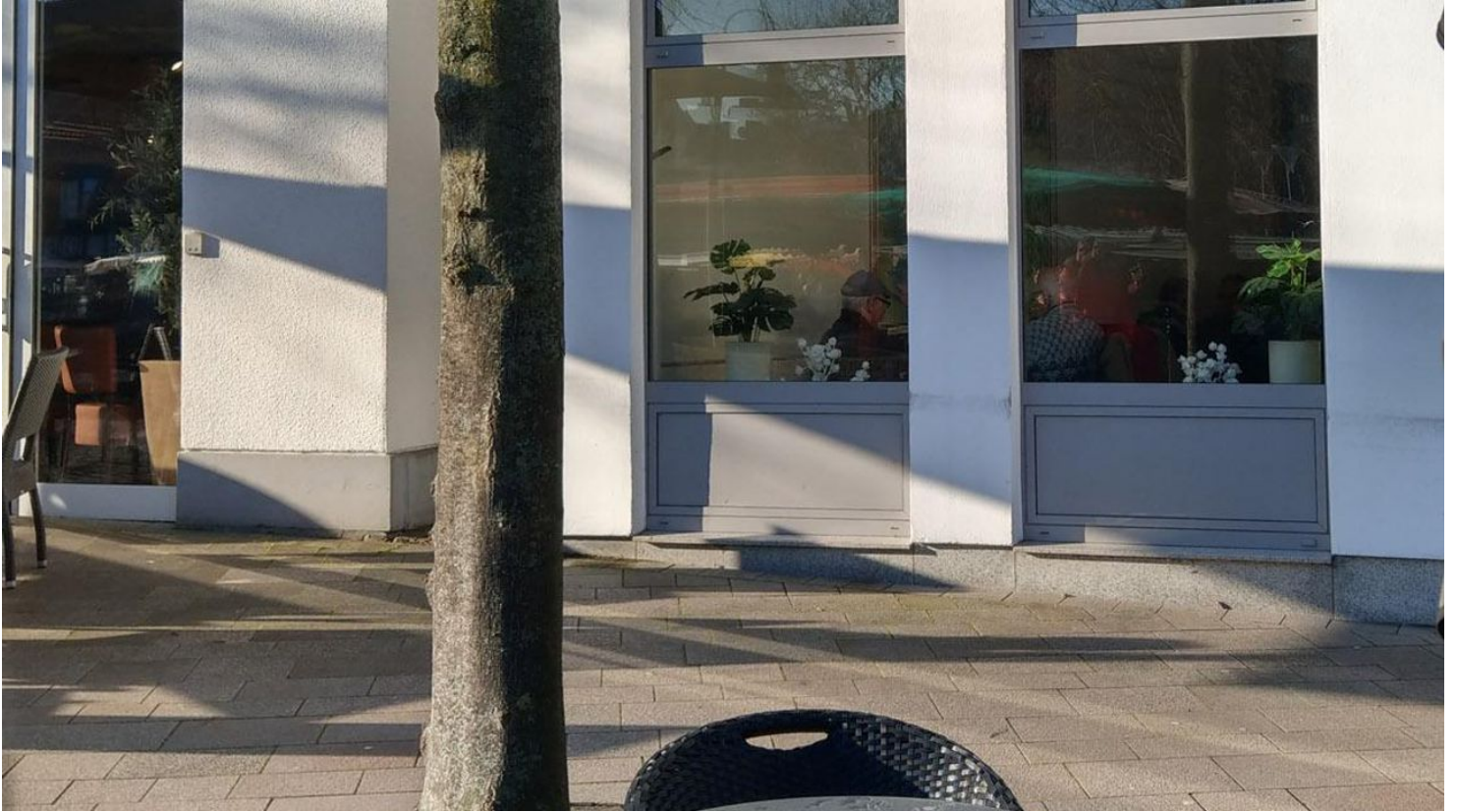
Eisübchen am Salzhof hoch