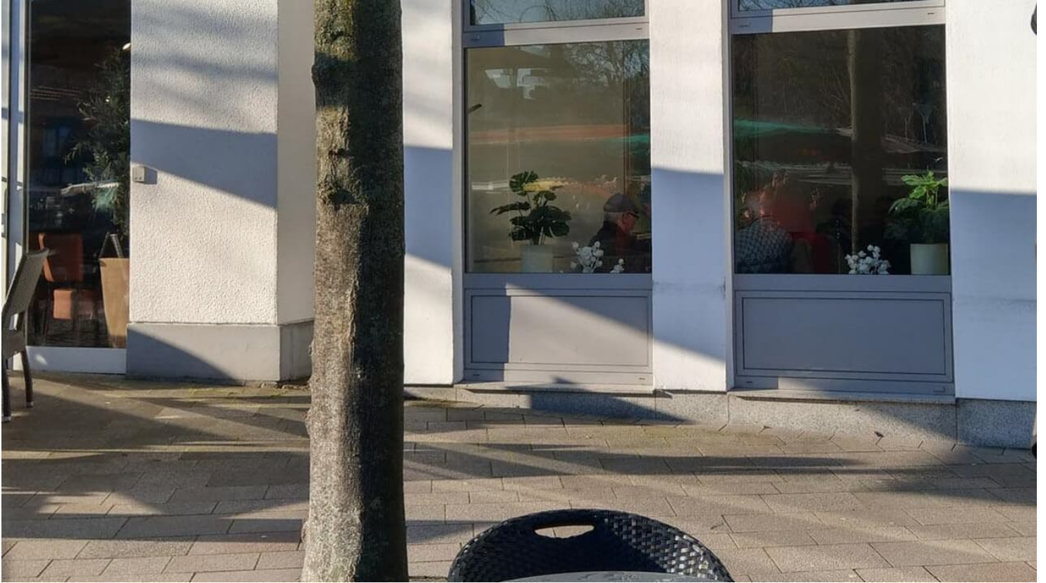
Eisübchen am Salzhof hoch