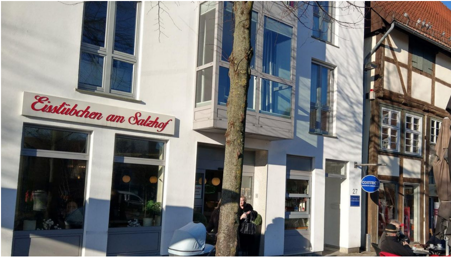
Eisstübchen am Salzhof quer