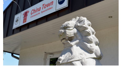
Außenansicht China Town