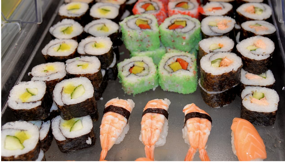
Sushi bei China Town