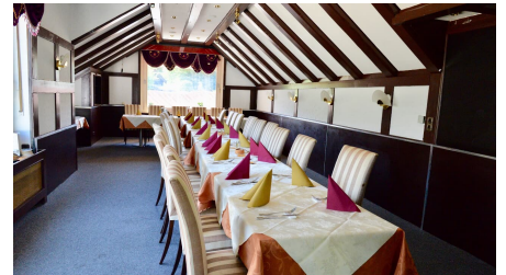
Raum für Festgesellschaften