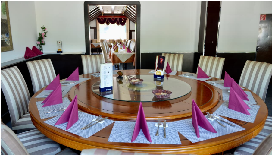
für gesellige Runden