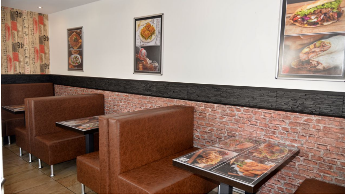
Sitzbereich im Kebap-Haus