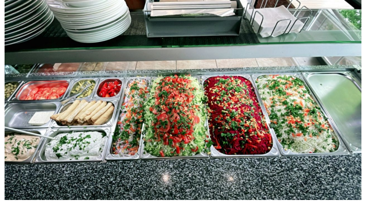
Salatbar im Kebap-Haus