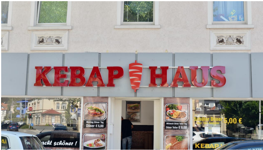
Kebab-Haus Außenansicht